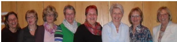
Dekanatsfrauenbeauftragten und Kontaktfrauen (Treffen April 2016)

Informationen der Frauenarbeit werden per Email aktuell übersandt – melden Sie sich, falls Sie in den Verteiler aufgenommen werden möchten